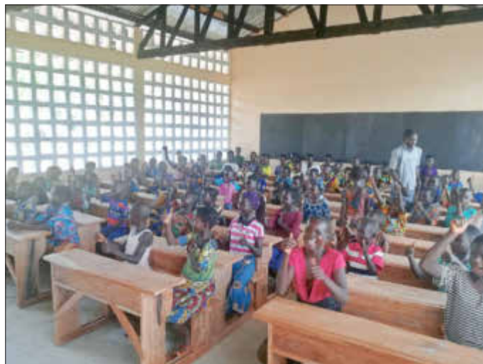
Schule und Klassenzimmer nach Fertigstellung Oktober 2021

Die Reiner Meutsch Stiftung FLY & HELP wird in diesem Jahr über 100 neue Schulgebäude in Entwicklungsländern bauen. Alle 3,5 Tage können sich somit hunderte Kinder über die Einweihung einer neuen Schule freuen! Der Bau der 500. FLY & HELP-Schule hat gerade in Togo begonnen.