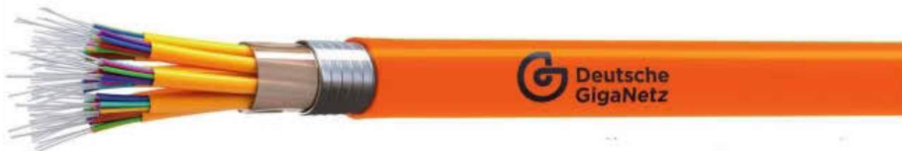
Glasfasernetz für Highspeed-Internet

Die Infrastruktur der Zukunft steht in Hohenstein auf der Agenda: Die Verwaltung der Gemeinde hat eine Kooperation mit der Deutschen GigaNetz GmbH für den Aufbau eines Glasfasernetzes geschlossen. Mit der Vereinbarung werden für die digitale Leistungsfähigkeit vor Ort neue Maßstäbe gesetzt. Gleichzeitig sind damit die Frage und Aufforderung an die Einwohnerinnen und Einwohner Hohensteins verbunden, sich ebenfalls aktiv für diese Investition in die Zukunft zu entscheiden. Im Zuge von „Homeoffice statt Pendeln“ gewinnt eine zuverlässige Anschlusstechnik für Highspeed-Internet immer weiter an Bedeutung.