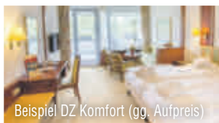
Beispiel DZ Komfort (gg. Aufpreis)

Ihr Hotel begrüßt Sie im schönen Strycktal u. a. mit zwei Restaurants, Bar mit Kamin, Terrasse, Fitnessraum, zwei Aufzügen, Fahrradverleih und einem großzügigen Wellnessbereich.