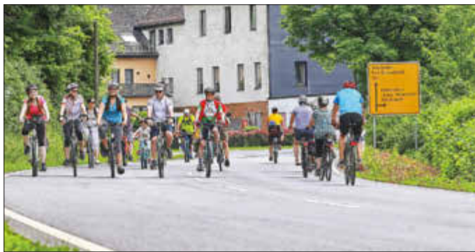
Fahr zur Aar 2018: Am Sonntag, 28. Mai gehört die Aarstraße zwischen Diez und Taunusstein den Radfahrern.

Die Strecke eignet sich besonders für Familien mit Kindern. Zahlreiche Stände bieten Speisen und Getränke an. Dazu gibt es ein buntes Programm mit Spiel, Spaß und Unterhaltung in den einzelnen Orten.