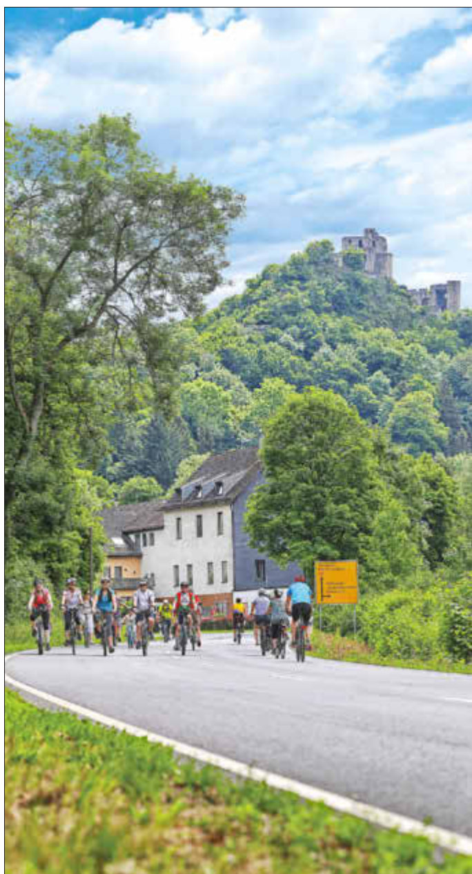
Fahr zur Aar 2018: Am Sonntag, 28. Mai gehört die Aarstraße zwischen Diez und Taunusstein den Radfahrern.

Radeln, Rollern, Inlinern und Wandern. Das alles ist am Sonntag, 28. Mai, auf der Bundesstraße B54 (Aarstraße) zwischen Diez und Taunusstein-Bleidenstadt möglich. Von 10.00 - 18.00 Uhr ist die Straße für den motorisierten Verkehr gesperrt und steht ganz unter dem Motto „Autofrei und Spaß dabei“. Die Strecke eignet sich besonders für Familien mit Kindern. Zahlreiche Stände bieten Speisen und Getränke an. Dazu gibt es ein buntes Programm mit Spiel, Spaß und Unterhaltung in den einzelnen Orten.