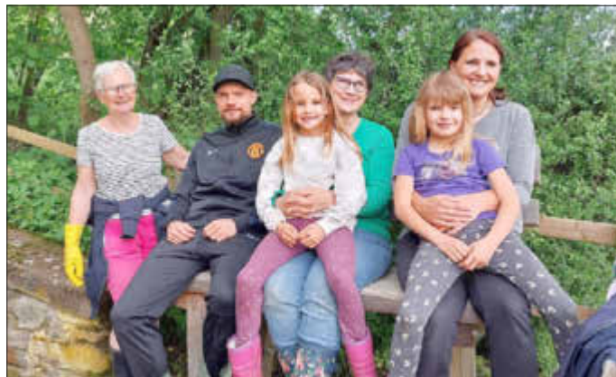
Neues Team Natur-Kneipp-Becken