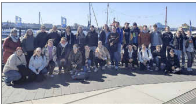
Teilnehmer und Teilnehmerinnen im Hamburger Hafen.

Fahrt mit dem Jugendbildungswerk Rheingau-Taunus-Kreis