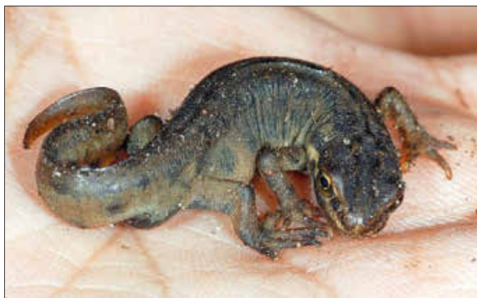
Bilder: Erdkröte und Teichmolch

Am Ende des Amphibienzuges zur Laichablage von Kröte und Co. in die Laichgewässer können wir resümieren, dass allein an diesem mobilen Zaun oberhalb des Golfplatzes, der dankenswerterweise von Mitarbeitern des Hofguts gestellt wird, insgesamt über 3.200 Amphibien sicher über die dort stark befahrene Landstraße getragen werden konnten. Im letzten Jahr waren es noch ca. 2.700 und im Jahr davor noch unter 2.000 Kröten, Frösche, Molche und andere Amphibien. Wir danken all unseren Aktiven und den vielen freiwilligen Helfern!