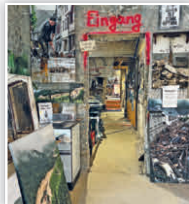
... die außer vielen Bildern auch mehrere Filmsequenzen beinhaltet.

AHRTAL. Afi. Auch fast zwei Jahre nach der verheerenden Flut ist das Ausmaß der Schäden entlang der Ahr weiterhin gegenwärtig. An vielen Stellen sieht es auf den ersten Blick noch immer nicht danach aus – doch es geht voran. Inhaber von Hotels, Restaurants und Geschäften haben, samt ihrer Mitarbeiter*innen, unzählige Stunden Arbeit, verbunden mit viel Hoffnung und Mut, in den Wiederaufbau ihrer geschäftlichen Existenzen gesteckt. Das Ziel: Endlich wieder zahlreiche Tages- und Übernachtungsgäste sowie Kundinnen und Kunden begrüßen zu können. Wanderfreudige Besucher*innen des Ahrtals dürfen sich, neben unvergesslichen Stunden in grandioser Natur entlang