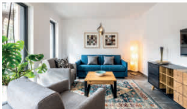
Hier lässt sich der Kurzurlaub im Ahrtal genießen.

Das Ahrtal braucht Sie Gastgeber und Einzelhandel freuen sich über jeden Gast und Kunden