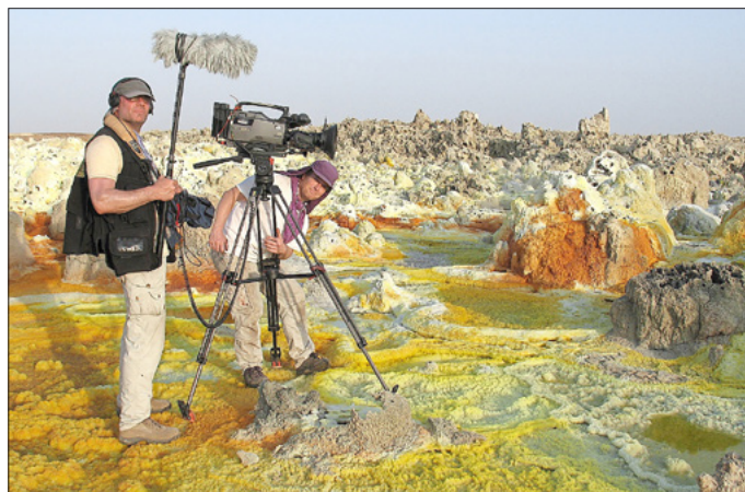
Afrika - Team in der Salzpfanne

Der Eintritt ist frei, Einlass ab 18.30 Uhr Veranstalter ist der TGSV Holzhausen über Aar.