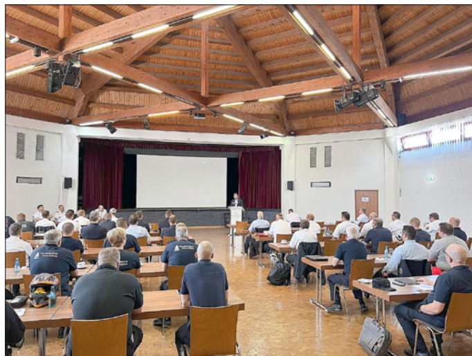
Teilnehmerinnen und Teilnehmer der Fortbildungsveranstaltung im Rheingau Atrium in Geisenheim.

Am vergangenen Samstag kamen im Rheingau Atrium in Geisenheim 70 Führungskräfte aus allen Bereichen der Gefahrenabwehr zusammen, um sich über Neuerungen auszutauschen und Schwerpunkte der verschiedenen Dienststellen zu erläutern. Auch wenn sie aus verschiedenen Bereichen kommen, eines hatten hier alle gemeinsam: die Gefahrenabwehr. So nahmen kommunale Brandinspektoren, Zugführer, Leitende Notärzte sowie die für diesen Bereich zuständigen Mitarbeitenden aus der Kreisverwaltung an der kreisweiten Veranstaltung teil.