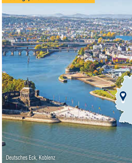
Deutsches Eck, Koblenz