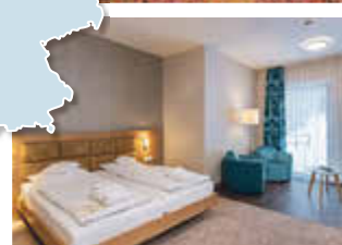
Bsp. DZ Deluxe (gegen Aufpreis)