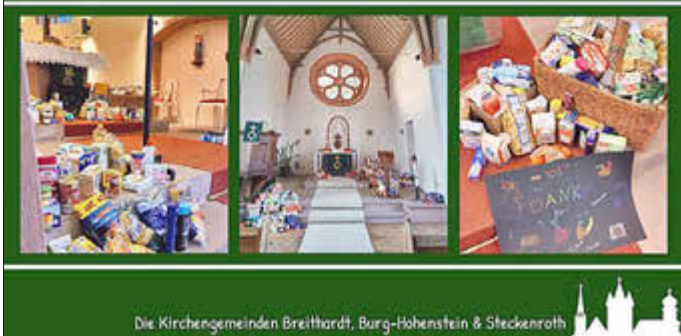
Die Kirchengemeinden Breithardt, Burg-Hohenstein & Steckenroth

Ihr habt die Erntedank-Feste dieses Jahr wieder zu etwas ganz Besonderem werden lassen!