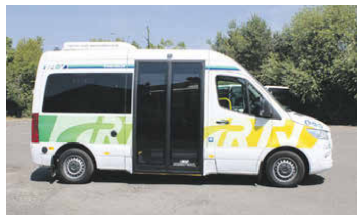
Rufbus im Rheingau-Taunus-Kreis

Fahrgäste im Untertaunus , die einen Rufbus buchen möchten, nutzen bitte folgenden Code: