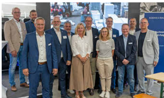
▲ LINUS WITTICH und Koenig & Bauer arbeiten gut zusammen.