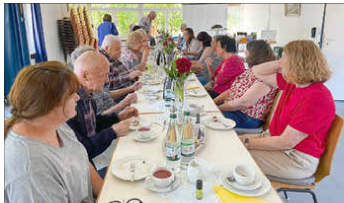
Der zweite Vortrag informierte am 2. Juni beim Seniorentreff Strinz-Margarethä in der Aubachhalle, über die Brandgefahren im Haushalt und das richtige Verhalten, sollte es doch mal brennen.

Im Rahmen der Brandschutzaufklärung der Feuerwehr Hohenstein konnten wieder zwei Veranstaltungen in unseren Ortsteilen durchgeführt werden. Bereits am 22. Mai waren wir mit dem neuen Vortrag „Stromausfall, und jetzt?“ bei dem Seniorentreff im Dorfgemeinschaftshaus in Hennethal zu Gast. Hier konnten sich die Teilnehmer darüber informieren wie man sich auf einen längeren Stromausfall vorbereiten kann und wie im Notfall Hilfe angefordert wird.