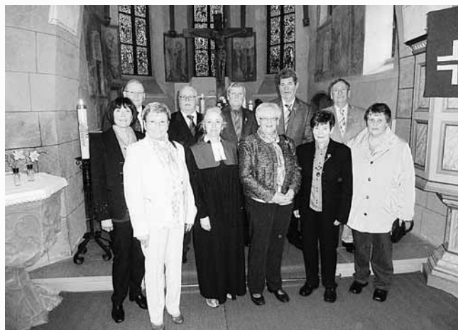
Goldene Konfirmation in Breithardt des Jahrgangs 1951/1952

Natürlich werden an einem solchen Tage nochmals alle Schandtaten und Streiche der Schulzeit aufgearbeitet und alte, - manchmal schon in Vergessenheit geratene Anekdoten – erzählt.