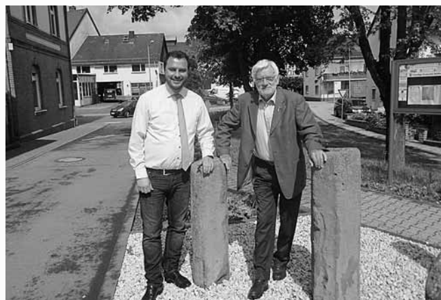
Vorsitzender des Lions Club Untertaunus

Hohensteiner Bus'je 0151/11 65 53 30 (während Fahrzeiten) Bitte bestellen Sie vor. Tel. 06120/2925 oder 2926 – Bus'je-Zeit