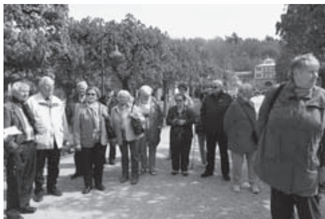
Alle lauschen aufmerksam einem Vortrag.

Die nächste Reise (2016) ist bereits in Planung! Höchstwahrscheinlich Anfang August soll sie noch einmal nach Bad Zwesten führen. Bereits 2010 hatte man sich dort im Landhotel Kern sehr wohl gefühlt.