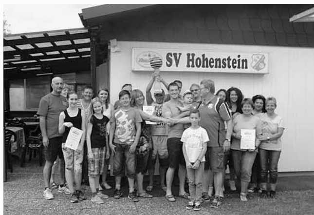
Allen Teilnehmern „Herzlichen Glückwunsch“!

Hier nun die Platzierungen der Boccia-Mannschaften: 1. Platz Team Trödeltrupp, 2. Platz SV Freizeitfußballer, 3. Platz 3 Freunde, 4. Platz Hohensteiner Burgnarren, 5. Platz SPD und CDU, 7. Platz Kippelhexen 1, 8. Platz Kippelhexen 2, 9. Platz Burgkäuzchen, 10. Platz SV Leichtathleten und 11. Platz Hohensteiner Burgnarren Stammtisch.