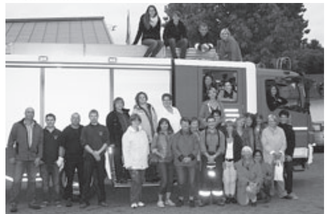
Am Samstag, den 14.09. fand bei der Feuerwehr Strinz-Margarethä ein Frauenaktionstag statt.