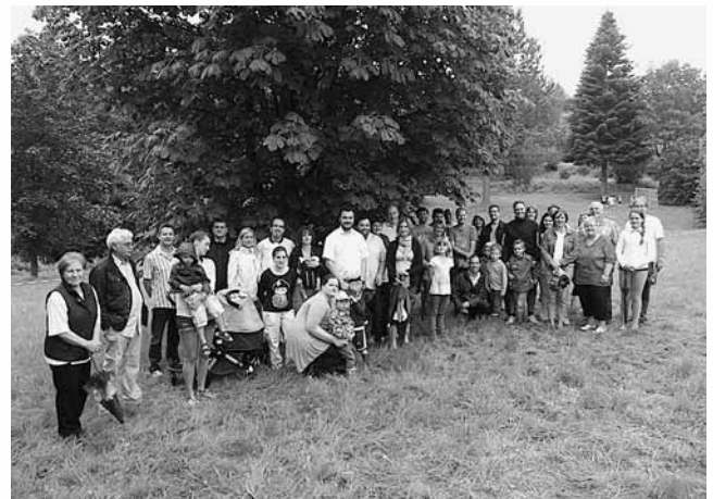
Bild: (50 Interessierte Bürger/innen aus Breithardt besichtigen den ehemaligen Park)

Den ca. 50 interessierten Breithardter Bürger/innen wurde erklärt, dass die Neuanlage beider Einrichtungen durch den Verkauf bzw. die derzeit begonnene Bebauung des alten Sportplatzes (Baugebiet „Balthsenau“) und des alten Feuerwehrgerätehauses/Sportlerheim notwendig wurden. Aus dem Kreis der Anwesenden haben sich 14 Eltern und Großeltern bereit erklärt, gemeinsam mit dem Ortsbeirat den neuen Bolz- und Spielplatz zu planen bzw. in die Tat umzusetzen. Erste Zusammenkünfte fanden bereits unter reger Beteiligung statt.