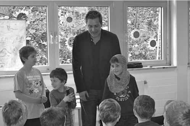
Das zweite Bild zeigt den Autor mit Knappen und Pagen, die Schwert und Kettenhaube tragen durften.