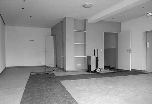
Im Hohensteiner Ortsteil Holzhausen über Aar gibt es 104 Jugendliche im Alter von 14 bis 21 Jahren. Schön also, dass die Gruppe Dorferneuerung derzeit in ihrer Konzeption den Neubau eines Jugendclubs vorgesehen hat. Gemeinsam mit Jugendlichen wurde das

notwendige Konzept erarbeitet. Es trägt den Titel „Jugendclub als Heimat im Dorf“. Jetzt ist er bezugsfertig und darf mit Leben gefüllt werden.