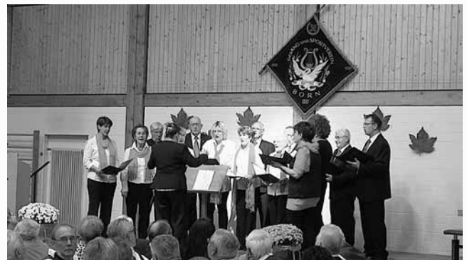
Bild: Chor des GSV Born

Viele Vereinsmitglieder sorgten für das leibliche Wohl der Gäste mit Speisen und Getränken. Zwischen den Auftritten der Chöre blieben den Zuhörern nur wenige Lücken für Gespräche. Trotz der Länge des Abends hielten fast alle bis zum Schluss aus. Es war ein von vielseitigem Genuss erfüllter Abend, für den sich alle Beteiligten gegenseitig danken können.