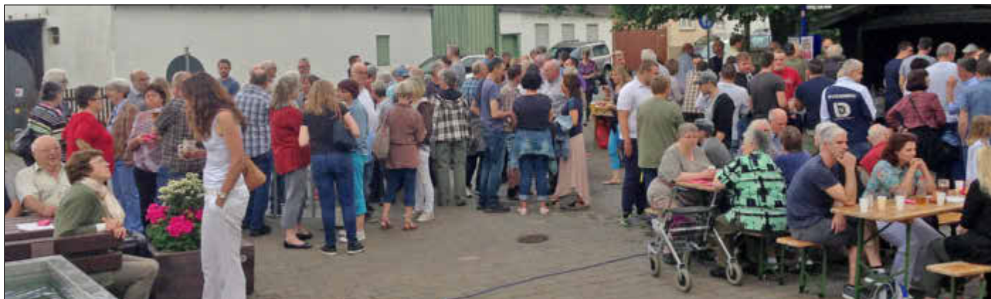
Das Fest wurde gut angenommen.