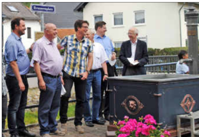
Enthüllung des Straßenschildes „Brunnenplatz“

So bekam das Bushäuschen einen neuen Anstrich, es wurden Ruhebänke mit Tischen installiert und ein neuer Wegweiser zeigt nun an, in welcher Richtung die französische Partnergemeinde Aube/Normandie liegt. Weiterhin wurden Blumenkübel aufgestellt, die mit viel Liebe bepflanzt wurden und für eine besondere Atmosphäre sorgen. Neue Infoschilder informieren über das alte Spritzenhaus, welches