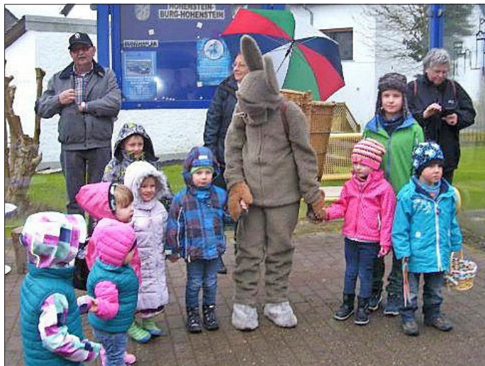
Der Osterhasen mit Kindern vor ihrem Abmarsch zu den Osternestern

In diesem Jahr konnte der Osterhase trotz eines kurzen Regenschauers kurz vor 11.00 Uhr mit trockenen Füßen und im Gefolge der vielen Kinder, Eltern und Großeltern seinen Gang von der Bushaltestelle Burg- Hohenstein die Hauptstraße herunter zum Sportplatz des SV Hohenstein 1953 e. V. antreten. Auf dem Sportplatz angekommen wurden sofort von den Kindern im Beisein des Osterhasen die Osternester gesucht auf der Wiese rund um die Weitsprung und Kugelstoßanlage.