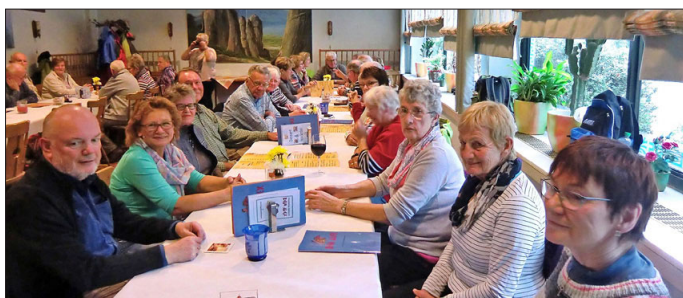
Schlussrast - Blick auf einen von zwei Tischen

Beide Gruppen wanderten an der hessisch-badischen Grenze entlang auf einem gut markierten Fernwanderweg in südlicher Richtung. Ein Betonturm, bei dem es rauschte, verriet die Lüftungseinrichtung des unter dem Berg hindurchführenden Saukopftunnels. Weil einige Wanderer der Kurzstrecke bei der ersten Pause noch keinen rechten Appetit hatten, wurde die an der nächsten Wegegabelung stehende Roth-Hütte als Einladung zu einer zweiten Jause angenommen. Hier entstand auch das Gruppenfoto. Die im weiteren Verlauf ursprünglich geplante Besteigung des Hirschkopfturmes ersparten sich beide Wandergruppen, denn Nebel gab es auch